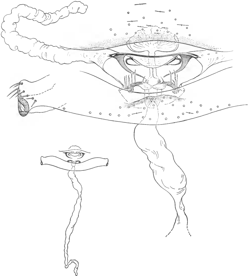
FIG. 15. — Neobisium (N.) balazuci n. sp. : région génitale du ♂ holotype.

♀ n° 2060, d'Aubenas. — Corps : 3,6 ; céphalothorax : 0,92 ; patte-mâchoire, fémur : 1,45-0,30 ; tibia : 1,07-0,40 ; échancrure tibiale : 0,37 ; pince : 2,30-0,62 ; main pédonculée : 1,15-0,62 ; doigt : 1,47 ; patte ambulatoire 4, fémur : 1,35 ; tibia : 1,10 ; basitarse : 0,45 ; télotarse : 0,67.